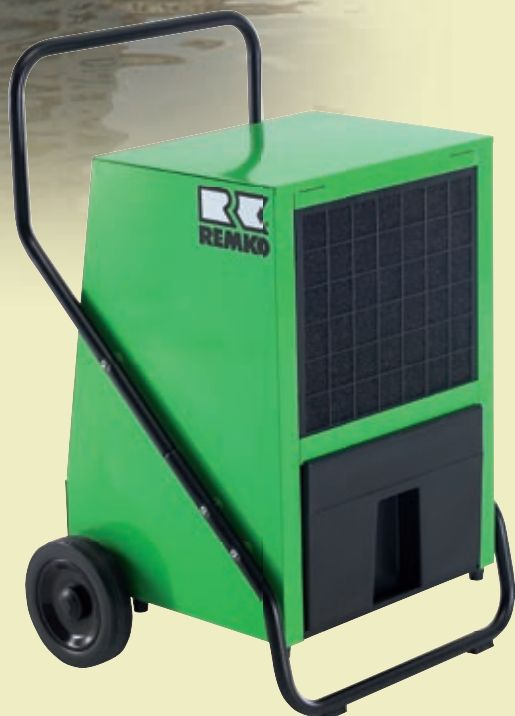
REMKO AMT 80-E