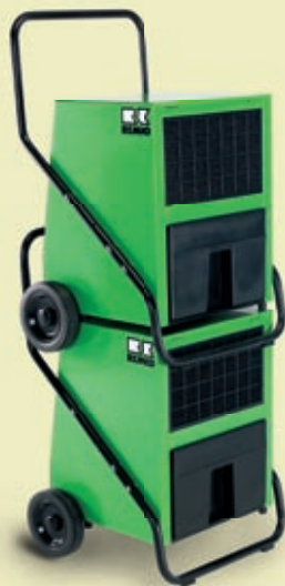
REMKO odvlhčovače jsou stohovatelné