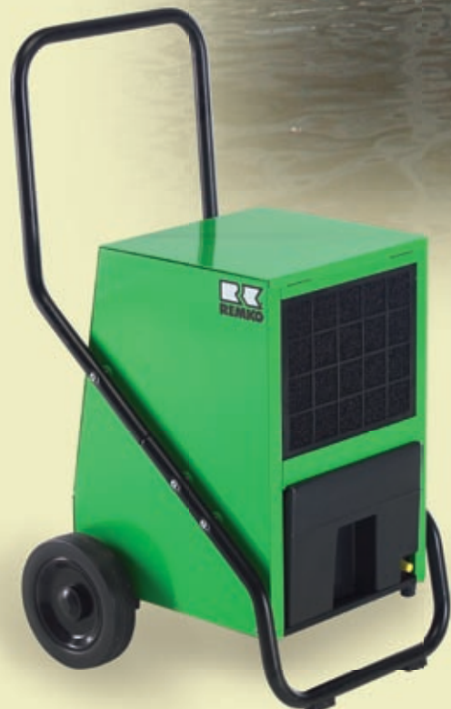
REMKO AMT 40-E