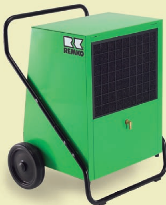
REMKO AMT 110-E