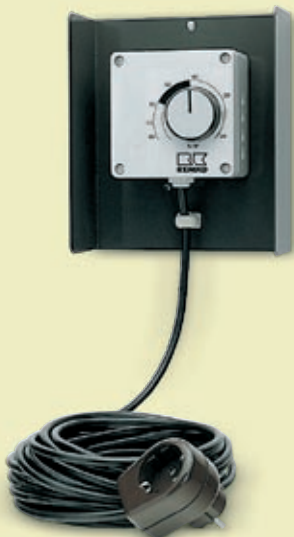
REMKO prostorový hygromet pro automatické ovládání přístroje

V zařízení zabudovaný ventilátor vhání vlhký vzduch přes výparník a zchladuje jej pod rosný bod. Tím se přebytečná vodní pára oddělí jako kondenzát a stéká do jímací nádoby. Odvlhčený vzduch je opět vyfukován do prostoru.